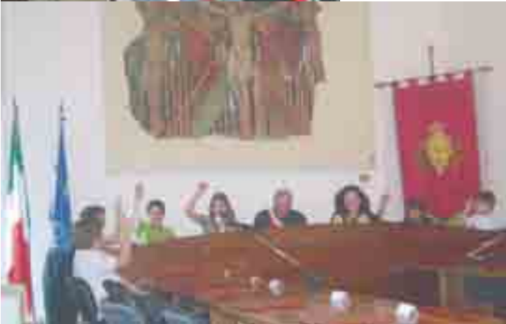
In alto: i Sindaci Junior dei Comuni di Polverigi, Camerata Picena e Agugliano. Qui sopra: l'insediamento del Consiglio Comunale dei Ragazzi di Polverigi.

Una volta eletti, i Sindaci Junior hanno tenuto il discorso d'insediamento presso le rispettive Sedi Comunali presentando i loro assessori e consiglieri ai Consigli Comunali Senior .