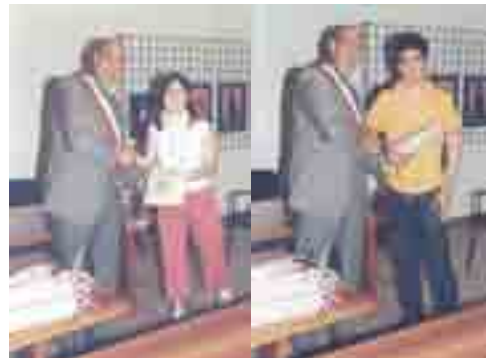
A lato: la platea dei diciottenni durante la cerimonia in Aula Consiliare. Sopra: due dei ragazzi che hanno ricevuto la Costituzione Italiana e lo Statuto di Polverigi in dono dall'Amministrazione Comunale.

comunità di immigrati, fornendo loro uno strumento utile nel momento dell'osservanza delle leggi italiane e della fruizione dei diritti riconosciuti a tutti.