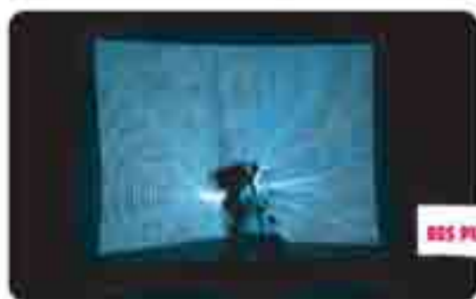
HES PUBLICA_WOLF KA

Infine, i francesi HES PUBLICA_WOLF KA proporranno Moving by numbers (4 e 5 luglio – Cortile Villa Nappi, Polverigi), installazione/performance coreografica interattiva per un solo spettatore alla volta ambientata in un dispositivo scenico interattivo in cui performer e pubblico sono allo stesso tempo soggetti ed oggetti dell'evento.