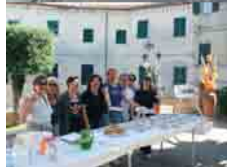
A lato: alunni nel parco di Villa Nappi, diretti a piedi verso la scuola ( Sani@piedi ). Sopra: sequenza di immagini della giornata di giochi e racconti intitolata “ Alla scoperta del paese ”.