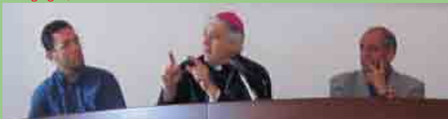
L'Arcivescovo durante l'incontro con il Consiglio Comunale e il personale del Comune.

La visita pastorale dell'Arcivescovo ha avuto i suoi momenti culminanti e conclusivi l'8 giugno, con la celebrazione della Cresima e della S. Messa domenicale.