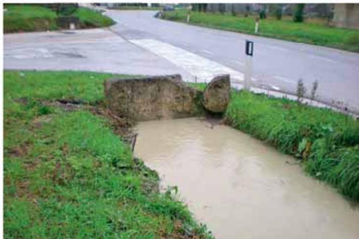
Fosso incrocio Via S. Egidio

A seguito di contributi regionali pari a 145.667,00 €, l'Amministrazione Comunale realizzerà dei lavori di adeguamento e ripristino lungo i fossi siti in Via Perna e Via del Vivaio, mentre con l'ulteriore finanziamento di 72.000,00 € per la sistemazione delle strade vicinali, si provvederà ad eseguire dei lavori di miglioramento di Via Bagno e Via Ne-