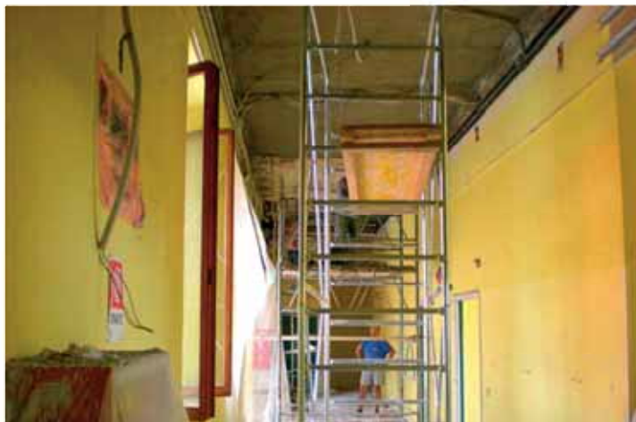
Lavori interno Scuola Elementare "Don Bosco"

Nell'edizione precedente si è parlato di dissesto idrogeologico collegando il fenomeno ai lavori di risanamento del centro storico. In questo numero si vuol portare all'attenzione la situazione dei fossi sul nostro territorio.