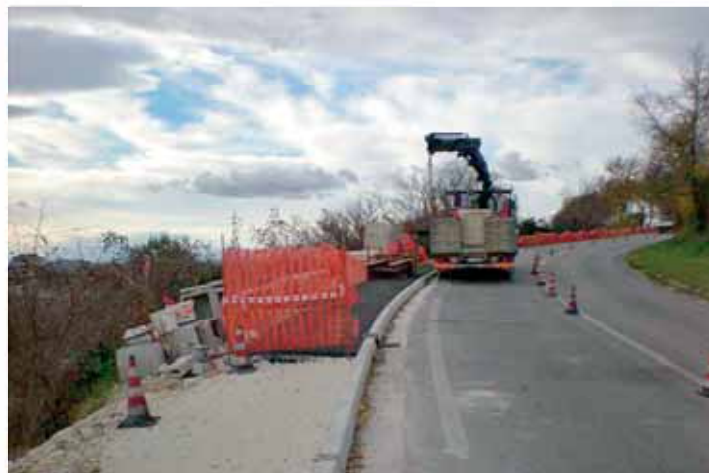
Realizzazione marciapiedi a Rustico

L'ultimo intervento eseguito è su via Acquasalata, il quale ha comportato la livellatura preliminare della sede stradale, con relativa chiusura delle buche, l'eliminazione delle creste ed il successivo apporto e stesura di materiale inerte. I costi di detti interventi sono recuperati dal fondo manutenzione comunale, i quali ci permettono ogni anno di dare una sistemazione adeguata e garantire a tutti una maggiore sicurezza alla viabilità minore, comunque utilizzata intensamente.