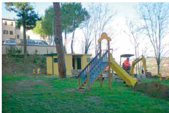
Bagno pubblico area verde P.zza Ragnini

vinciale, e sempre su Via Circonvallazione la Multiservizi sta ultimando i lavori di posa di una condotta idrica per migliorare il servizio idrico, al termine dei quali provvederà all'asfaltatura del tratto che va da Via D. Alighieri ai campi da tennis. Inoltre la Multiservizi sta potenziando il servizio su via Marcilliana.