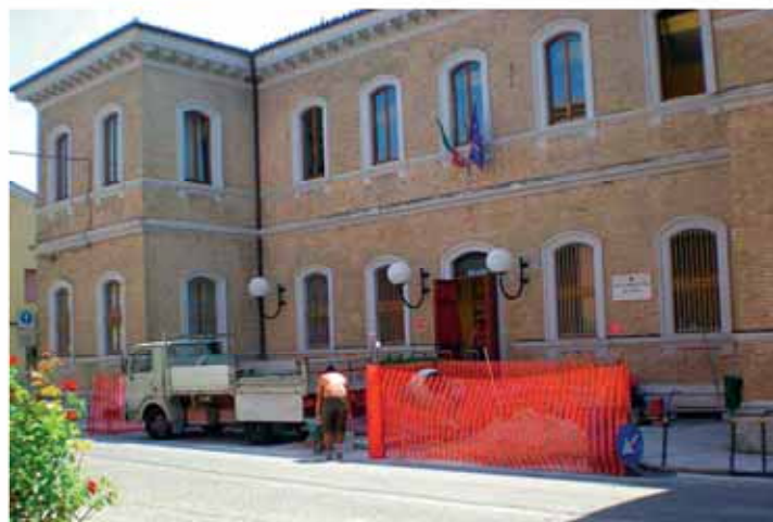
Cantiere Scuola Elementare "Don Bosco"

Su Via Don Vincenzo Bianchi, le ditte lottizzanti stanno realizzando l'incrocio canalizzato che immette sulla Strada Provinciale S.P. 2 Sirolo-Senigallia. A breve dovrebbero partire anche i lavori di realizzazione della piazzola di sosta per la fermata dell'autobus, mentre per quanto riguarda la