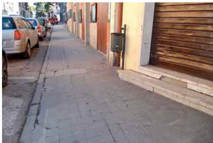
Marciapiedi Via Marconi

La salvaguardia del territorio si può assicurare solo con un'attenta gestione e tutela delle zone, con la sistemazione idraulica, ma anche con una corretta sistemazione agraria e forestale. Sicuramente molti fenomeni si stanno sommando tra loro, per esempio la cementificazione del territorio porta dei problemi, ma a questi si sono aggiunti quelli portati dai cambiamenti climatici, con una maggiore intensità delle precipitazioni e con l'impossibilità dei terreni di assorbire la quantità di acqua che precipita in pochi minuti, una somma di circostanze che ci deve far riflettere e deve obbligarci ad una più attenta politica della prevenzione.