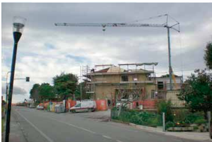
Lavori al Centro Sociale di Rustico

Sono in corso i lavori per la riqualificazione del centro e delle aree mercatali del capoluogo, con la costruzione di bagni pubblici nell'area dei giardini tra i parcheggi di Piazza Ragnini e Via Fossarile. A Rustico, mentre sono terminati i lavori di demolizione e ricostruzione dell'immobile che ospita il Centro Sociale, sono in fase di svolgimento quelli di rifinitura e quelli che interessano la parte non demolita, inizialmente non previsti, che riguardano sostanzialmente il rifacimento del tetto e la sostituzione della vecchia pavimentazione. Inoltre sono in fase di completamento i lavori di realizzazione del nuovo marciapiede che collega Via Mulino San Filippo con l'area verde polivalente.