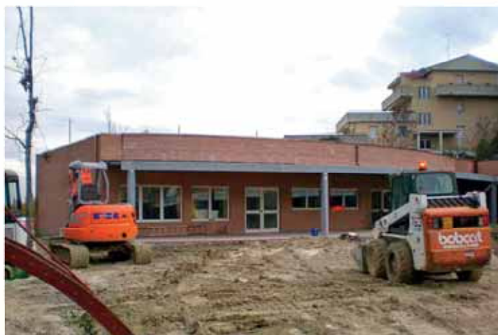
Ampliamento della Scuola Materna "Colorella"

Durante le vacanze scolastiche estive sono stati realizzati a seguito di controlli ministeriali, i lavori di messa in sicurezza alla scuola elementare (intonacatura dei solai al PT), ed installato l'ascensore presso la scuola media (in questi giorni si stanno eseguendo le certificazioni). Sono pressoché conclusi i lavori di ampliamento della scuola "Colorella", mentre l'impianto geotermico è in fase di ultimazione.