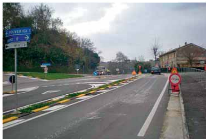
Incrocio tra Via Circonvallazione e Via Matteotti

costruzione del marciapiede lungo Via del Conero, l'Amministrazione Comunale ha espletato la gara d'appalto che ha visto aggiudicataria la Ditta Gatti e Purini di S. Severino Marche. Sono terminati i lavori all'incrocio tra Via Circonvallazione e Via Marconi eseguiti dall'Amministrazione Pro-