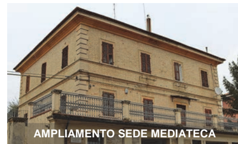
AMPLIAMENTO SEDE MEDIATECA

Sono intanto iniziati i lavori di ampliamento dei locali della Mediateca , grazie ad uno specifico finanziamento regionale di 20.000€. Partiranno invece a breve gli appalti per la sistemazione ed adeguamento dei locali attigui all'Ufficio Anagrafe, che recentemente ci sono stati trasferiti dal Demanio dello Stato, e che saranno destinati ad uffici per fini istituzionali, nonché il bando per l'affidamento dei lavori di realizzazione delle rete wi-fi gratuita in P.zza Umberto I°.