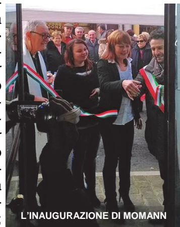
L'INAUGURAZIONE DI MOMANN

A tutti va l'augurio di buon lavoro e di un nuovo anno ricco di soddisfazioni, ringraziandoli per il prezioso contributo offerto, a servizio della collettività.