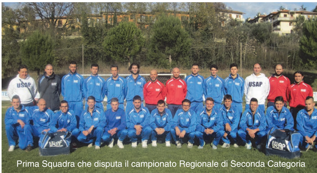
Prima Squadra che disputa il campionato Regionale di Seconda Categoria