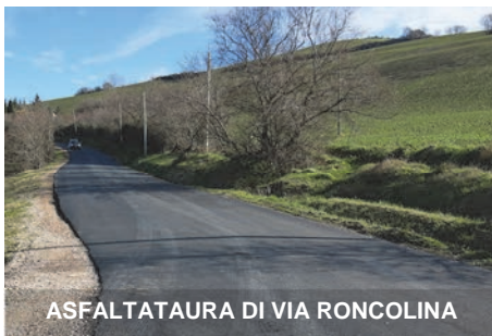
ASFALTATAURA DI VIA RONCOLINA

del 2014 sono stati effettuati importanti lavori di manutenzione, il più importante dei quali è rappresentato dalla sistemazione e asfaltatura della parte alta di Via Roncolina, per un tratto di circa 1,3 km. Precedentemente, sulla stessa strada erano stati effettuati, da parte di Multiservizi, lavori di posa di una nuova tubazione per l'acqua potabile, in sostituzione della vecchia condotta fortemente deteriorata.