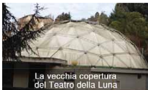
La vecchia copertura del Teatro della Luna

Sul finire del 2016 sono state espletate la procedure di gara per la sostituzione del telo di copertura del Teatro della Luna , e la sua riqualificazione interna. Nel mese di gennaio sono stati affidati i lavori ed è prevista l'installazione di una nuova copertura, sia oscurante che ignifuga, in classe A1 per quanto riguarda la normativa di prevenzione incendi; i lavori dovrebbero terminare entro breve. Sono inoltre