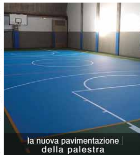
la nuova pavimentazione della palestra

Nel 2016 sono stati inoltre inaugurati i locali della nuova sede Polizia Locale e del Centro del Riuso , a cui già si era accennato nella precedente edizione di questa rivista.