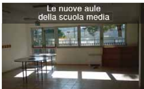
Le nuove aule della scuola media

L'opera pubblica da citare "in primis", relativamente al 2016, riguarda i lavori di riorganizzazione dei locali sottostanti la palestra della scuola media che, una volta resi disponibili, hanno permesso la realizzazione di due nuove aule speciali (aula informatica ed artistica), un nuovo locale per archivio , i relativi servizi, e la nuova pavimentazione della palestra con il miglioramento dell'isolamento acustico, oltre a opere di finitura esterne. Tale intervento ha reso disponibili nuovi spazi didattici all'interno del plesso della scuola media.