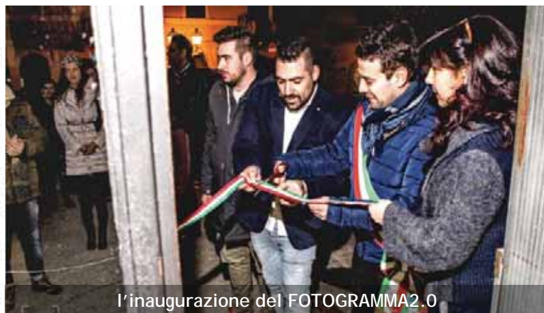
l'inaugurazione del FOTOGRAMMA2.0

Sicuramente positive, e da incoraggiare al massimo, le aperture di due nuove attività commerciali in piazza Umberto I°, in sostituzioni altrettante recenti cessazioni. Sia il negozio di fotografia "il Fotogramma 2.0" che il fioraio "il Mughetto", utilizzano dei locali in affitto, di proprietà del Comune di Polverigi. Nel porgere ad entrambi i nostri migliori auguri di buon lavoro, ringraziamo anche la precedente gestione de "il Fotogramma" per la dedizione ed il servizio svolto per la comunità. Segnaliamo inoltre che l'Amministrazione Comunale intende emanare un nuovo Bando pubblico per affidare la gestione dei locali di Villa Nappi, adibiti a ristorante e della attigua costruzione esterna.